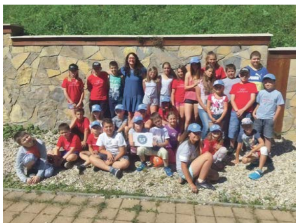
So Soroptimistkami organizujú každý rok bezplatný letný tábor pre deti zo sociálne slabších rodín.